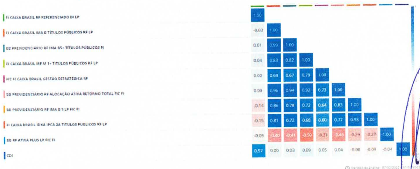
Gráfico de Correlação

56 Considerando a atratividade do CDI no cenário atual, o acréscimo de diversificação e que o 57 fundo não tem exposição a crédito privado, entendo que o produto pode compor a carteira do 58 Macaeprev na busca de um retorno adicional ao CDI. Em caso de decisão favorável ao